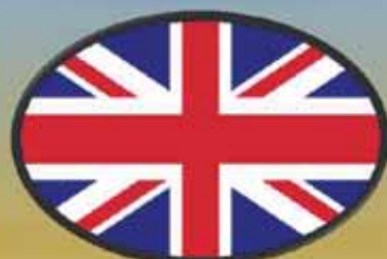
ANGIELSKI, ANGIELSKI BIZNESOWY

Ucz się za darmo, w dowolnym miejscu i czasie!