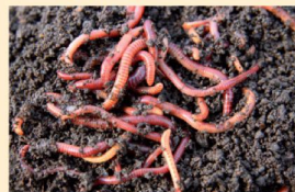
7. Proces kompostowania możemy wspomóc, dodając do kompostownika dojrzały zeszloroczny kompost oraz zebrane na działce dżdżownice. Przyspieszy to przemianę odpadków w nawóz.