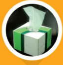
chusteczki higieniczne, papier śniadaniowy, szary karton, tektura