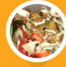
odpadki kuchenne (resztki warzyw i owoców, obierki, skorupki z jaj)