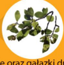
liście oraz gałązki drzew i krzewów (cieńsze niż 2 cm)