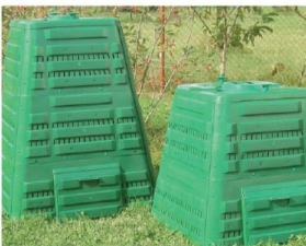
Kompostownik plastikowy – dostępne są różne modele – zdecydowanie droższy, lecz łatwiejszy w utrzymaniu.