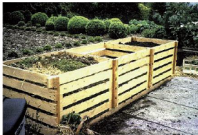
Kompostownik drewniany – zbity z desek – znacznie tańszy, za to wymaga okrycia w zimie materiałem izolacyjnym.