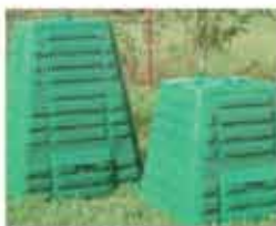
Kompostownik plastikowy - dostępne są różne modele - zdecydowanie droższy, lecz łatwiej w utrzymaniu.