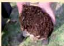
8. Po ok. 9-12 miesiącach powstanie dojrzały kompost, przypominający wyglądem i zapachem świeżą ziemię. Można go wykorzystać w ogródku jako naturalny nawóz.