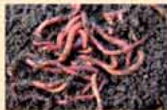
7. Proces kompostowania możemy wspomóc, dodając do kompostownika dojrzały deszlaczony kompost oraz zebrać go na działce dżdżownic. Przypieczys to przemianę odpadków w nawóz.