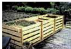
Kompostownik drewniany - zbudowany z desek - znacznie tańszy, za to wymaga okrycia w zimie materiałem izolacyjnym.