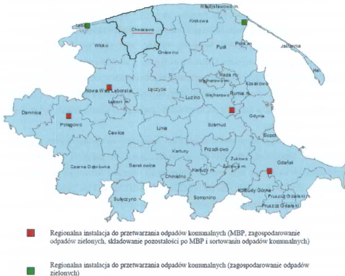
Ryc. 2. Gmina Choczewo w Północnym rejonie gospodarki odpadami. Opracowanie własne na podstawie ryc. z Planu Gospodarki Odpadami dla Województwa Pomorskiego 2022.