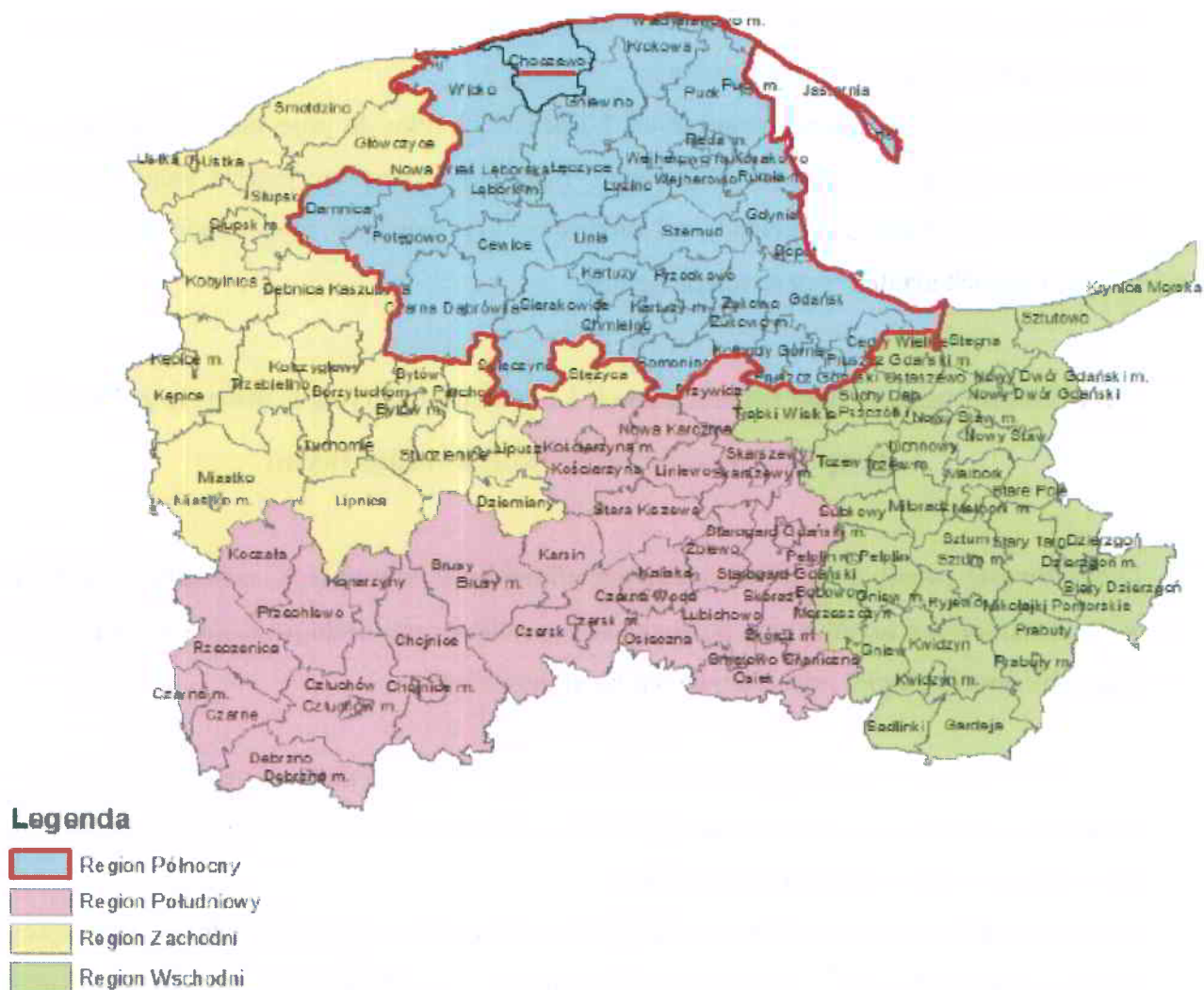
Ryc. 1. Podział województwa pomorskiego na rejony gospodarki odpadami – gmina Choczewo w rejonie gospodarki odpadami. Opracowanie własne na podstawie ryc. z Planu Gospodarki Odpadami dla Województwa Pomorskiego 2022.

Podstawowym założeniem funkcjonowania gospodarki odpadami komunalnymi w Polsce jest system rozwiązań regionalnych. Zgodnie z ustawą o odpadach region gospodarki odpadami komunalnymi stanowi obszar sąsiadujących ze sobą gmin liczących łącznie co najmniej 150 tys. mieszkańców. Regionem gospodarki odpadami komunalnymi może być również obszar gminy liczącej powyżej 500 tys. mieszkańców. Regiony gospodarki odpadami komunalnymi obsługiwane są przez regionalne instalacje do przetwarzania odpadów komunalnych (RIPOK). Na terenie regionu Północnego, do którego należy gmina Choczewo funkcjonują 4 duże regionalne instalacje do przetwarzania odpadów komunalnych (RIPOK Szadółki, RIPOK Eko Dolina, RIPOK Czarnówko, RIPOK Chlewnica), które zapewniają mechaniczno-biologiczne przetwarzanie odpadów komunalnych, zagospodarowanie odpadów zielonych i innych