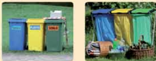
Jeżeli z gniazd recyklingu w białym. Najczęściej stosowane rozwiązanie przy selektywnej zbiórce odpadów. Pojemniki i worki do selektywnej zbiórki z rodzajów odpadów.

Wszystko zależy od przyjętego w danej gminie systemu. Może to być segregacja workowa lub kontenerowa (2- 5 rodzajów odpadów).