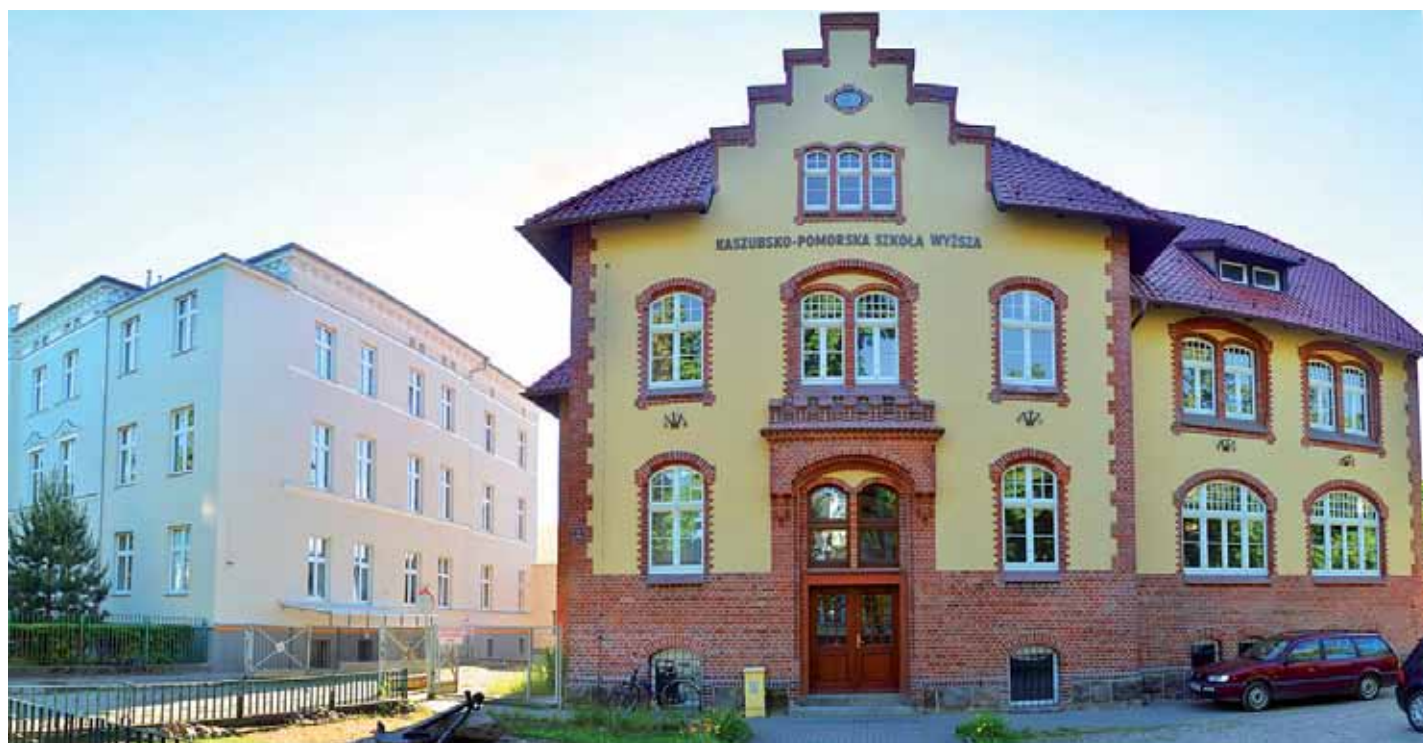
Siedziba Powiatowej Komisji Lekarskiej w Wejherowie ul. Dworcowa 7 (budynek Kaszubsko-Pomorskiej Szkoły Wyższej w Wejherowie).

INFORMACJI szczegółowych dotyczących kwalifikacji wojskowej można uzyskać w Urzędzie Gminy Choczewo. Informacji udziela inspektor Krzysztof Cudnik w pokoju Nr 8, tel. 58 572 39 40; 58 572 39 13 wew. 211.