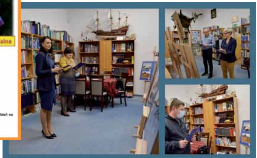
Komisja Konkursowa oceniająca fotografie złożone na konkurs „Z książką naturalnie”