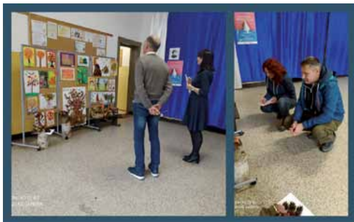
Komisja Konkursowa oceniająca prace złożone na konkurs „Jesienne inspiracje”