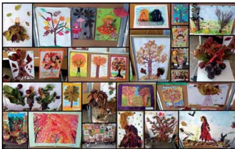
Konkurs Plastyczny „Jesienne inspiracje”