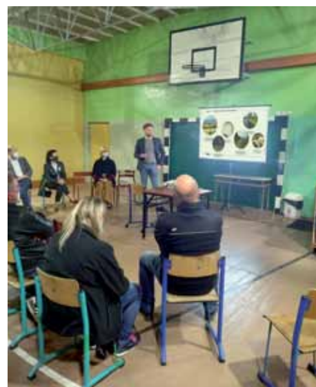
Spotkanie sołectwie inwestorów z mieszkańcami w Zwartowie.

Łącznie w rozmowach udział wzięło około 60 mieszkańców. Na każdym spotkaniu byli obecni eksperci z zakresu prawa, inżynierii i planistyki, którzy odpowiadali na pytania związane z projektem. W trakcie spotkań stosowano wszelkie środki ostrożności związane z sytuacją epidemiczną.