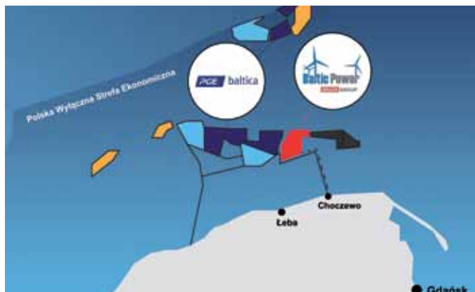
Orientacyjna lokalizacja planowanych morskich farm wiatrowych, w tym realizowanych przez PGE Baltica i Baltic Power.

Dzięki nim Pomorze stanie się nie tylko samowystarczalne pod względem produkcji energii elektrycznej, ale przyczyni się do jej przesyłu do innych części kraju. Energia z wiatru na Bałtyku wesprze pracę Krajowego Systemu Elektroenergetycznego oraz przyczyni się do wzmocnienia polskiej gospodarki poprzez zasilanie przedsiębiorstw i gospodarstw domowych oraz budynków użyteczności publicznej, w tym szkół czy szpitali.