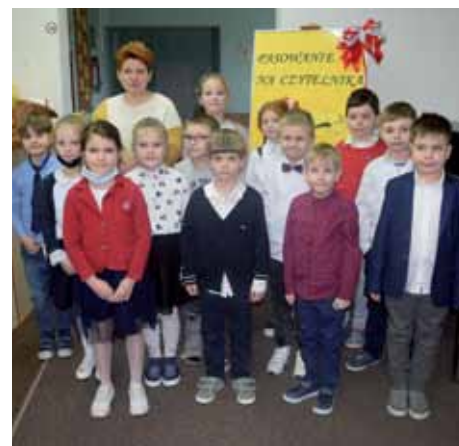
Aktyw Biblioteczny ZSP w Choczewie