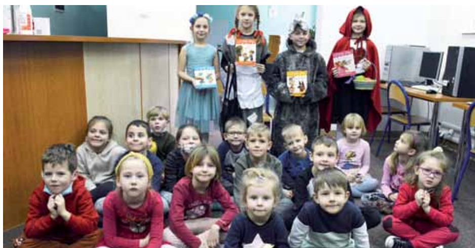
Aktyw Biblioteczny ZSP w Choczewie